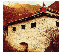
The "Temple Of Miraculous Fire" at Muktinath, Nepal. Photo by Ken Street (November 1979).

[For more on this subject, please read our tract The Temple Of Miraculous Fire. ]